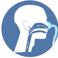
التهوية بالضغط الإيجابي المستمر

هناك نوعان من التهوية الميكانيكية عبر القناع المستخدمة في المنزل. سيحدد لك طبيبك النوع الأكثر ملاءمة بالنسبة لك وفق حالتك الصحية. كما سيحدد الإعدادات (العيارات) التي عليك استخدامها.